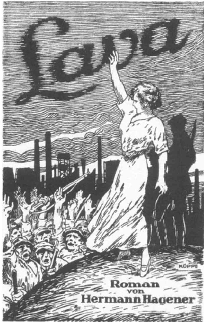
Cover of a novel (1921).

Angst van “feminisering” “vloeden” “decompositie” (Klaus Theweleit)